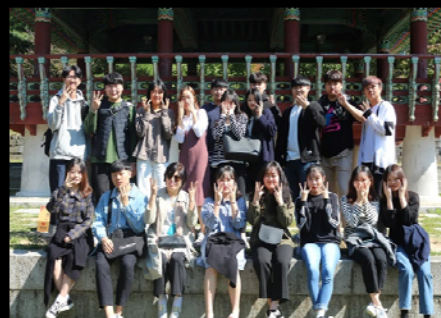
<고조리서 수업 & 가을소풍>