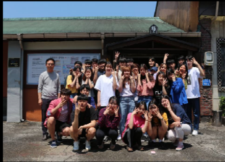
<막걸리 제조 장 방문& MT>