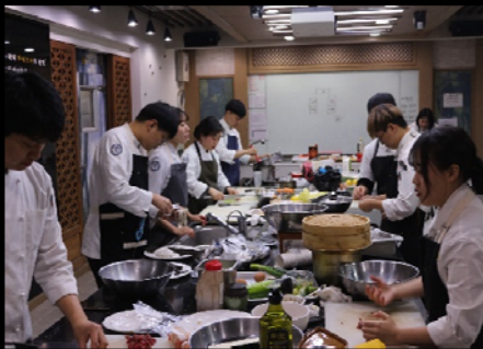
<고조리서 재해석 메뉴개발>