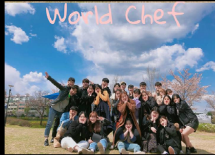
<도시락 만들기와 봄 소풍>