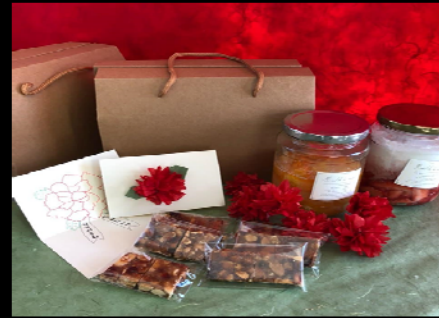
<어버이날 감사선물 만들기>