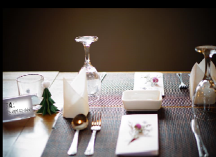
<부모님 초청 행사>