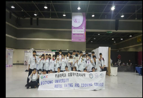
<국제푸드엔테이블 대회 참석>