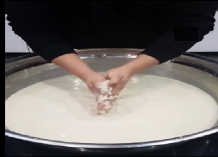
<전통주 제조 실습>