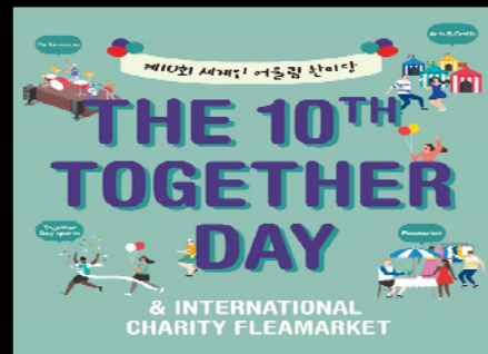
<세계인 어울림 축제 폴리마켓>